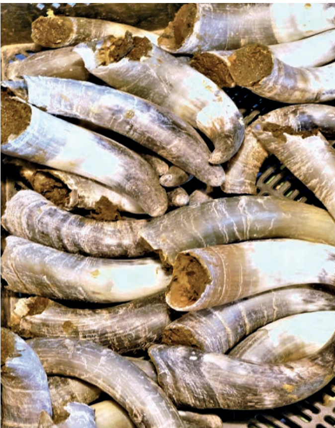
Herstellung des Hornmistpräparats an Michaeli

Spätere Termine und Terminänderungen sind im Kalender auf unserer Website einzusehen: www.loheland.de