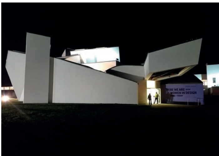
Vitra Design Museum