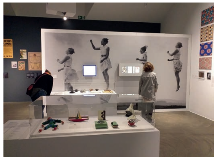
Loheland Exponate in der Ausstellung