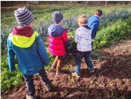
Bei der Sellerieernte