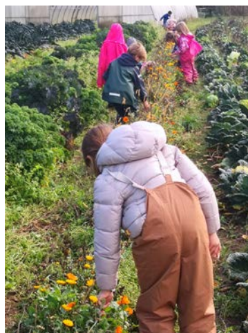
Wir ernten Ringelblumensamen