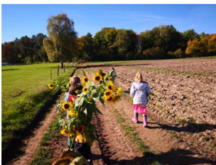
Die letzten Sonnenblumen