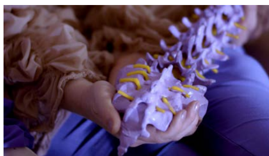
JULIA ROMAS Die Ecken im Zimmer öffnen einen Raum, der mich schützt, 2023 Filmstill