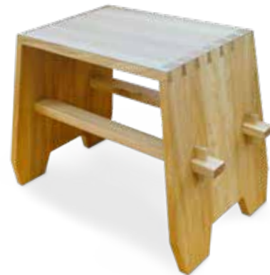
Reproduktion eines original Loheland Hockers aus den 1920er Jahren.

Wir sind Handwerker mit Herzblut und Leidenschaft – das spiegelt sich in unserem Tun wider. Wir verarbeiten nur ökologisch sinnvolle Hölzer und verpflichten uns, nachhaltig zu handeln.